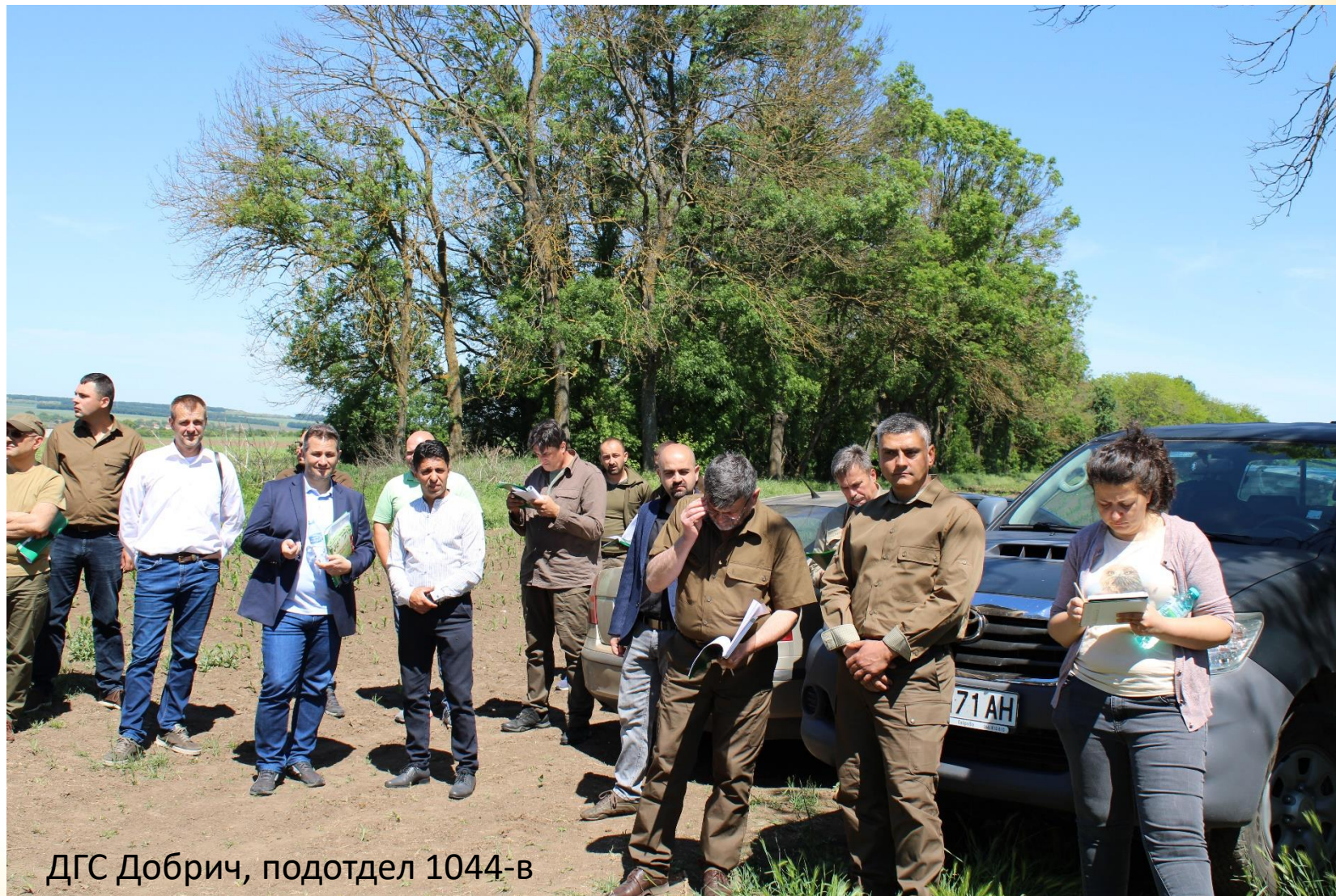
ДГС Добрич, подотдел 1044-в