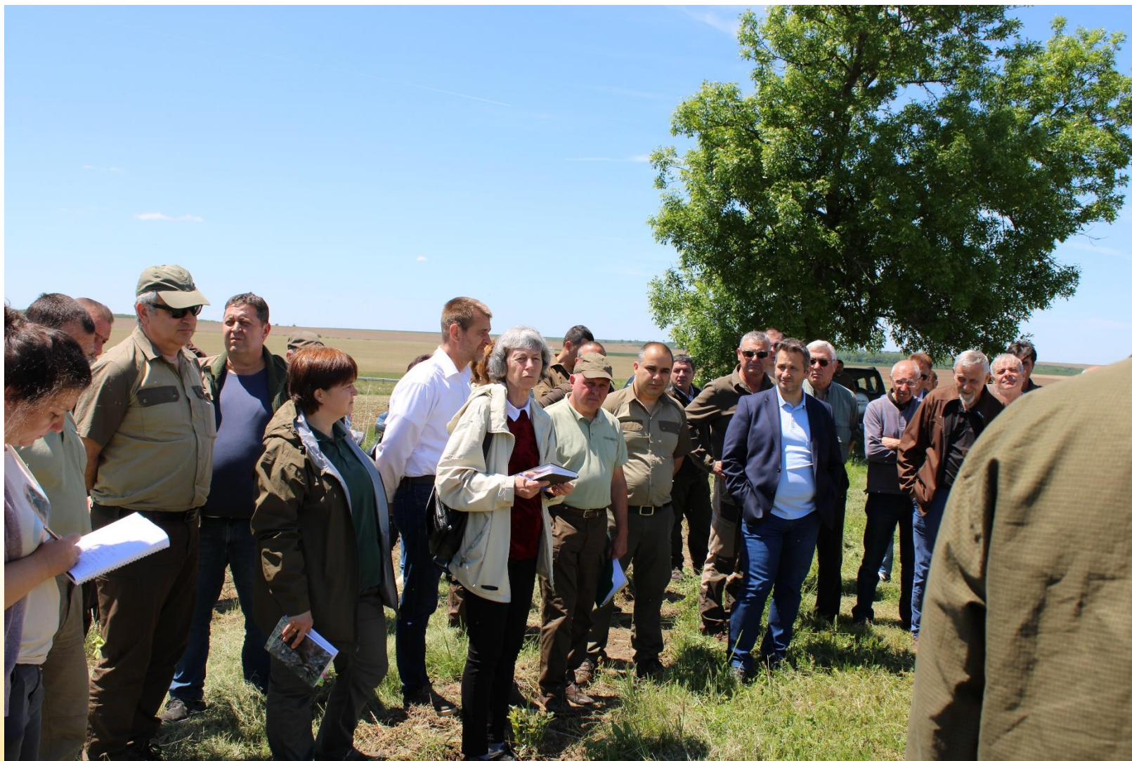
Обмяна на опит и идеи между наука и практика