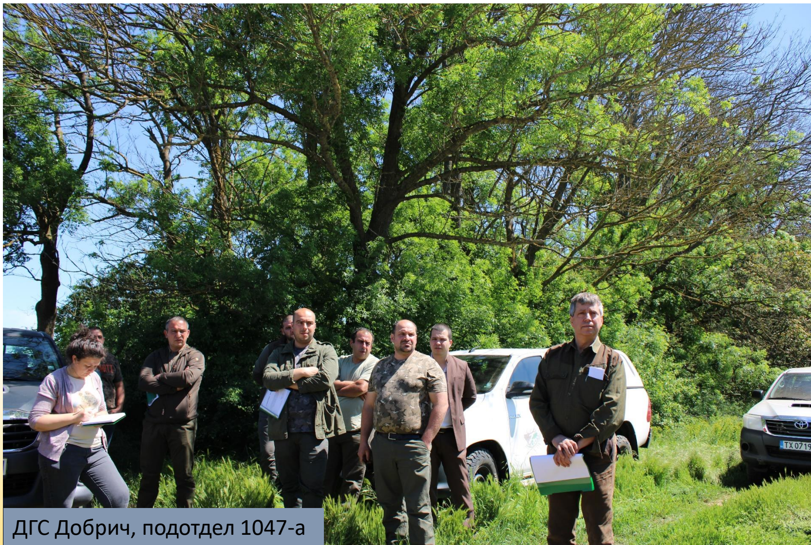
ДГС Добрич, подотдел 1047-а