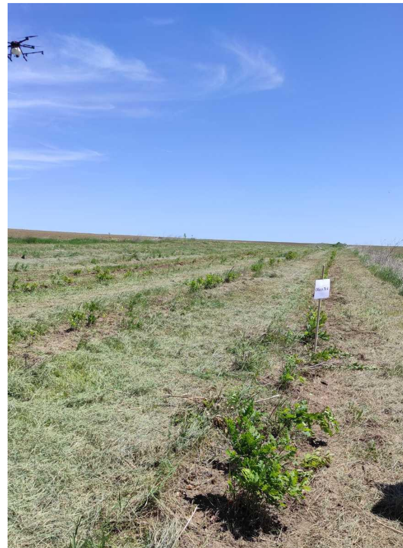
Засаден през 2019 г. церов жълд